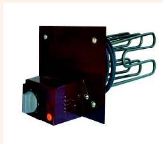
Elektryczny wkład grzejny do pieca kaflowego typ WG3