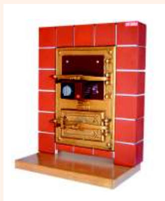
Wkład grzejny zamontowany w drzwiczkach pieca kaflowego