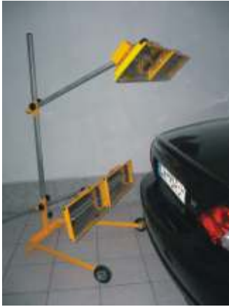
Typ A - 4P