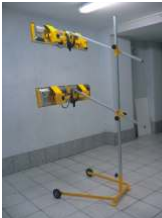
Typ B - 4P