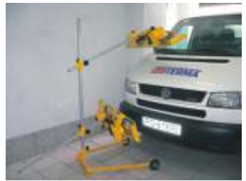
Typ A - 4P