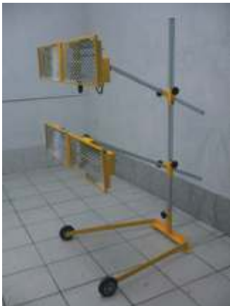
Typ A - 4P