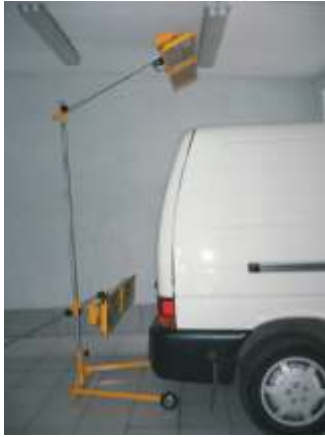
Typ B - 4P