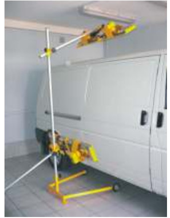
Typ B - 4P